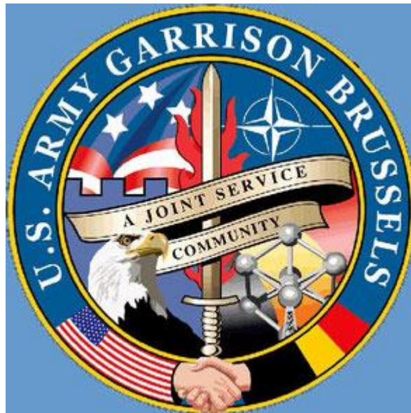
Emblème de la United States Army Garrison, Brussels, Belgium

La Belgique est sous occupation militaire états-unienne depuis 1945. Il s'agit d'une information publique, tellement connue de tous depuis si longtemps qu'à peu près personne ne s'en rend compte.